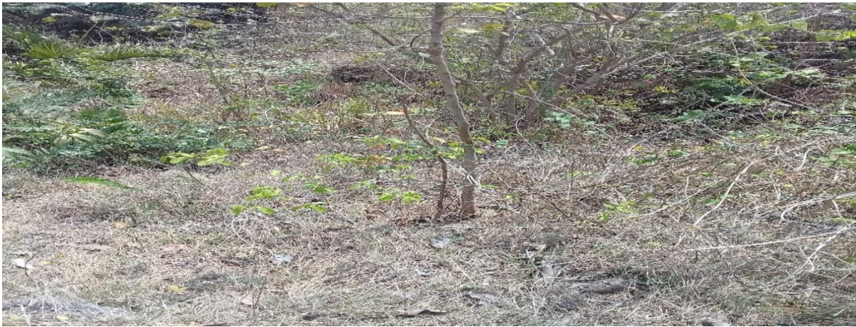
Imagen 1: Limpieza cuenca Arroyo Samudio – Antes.