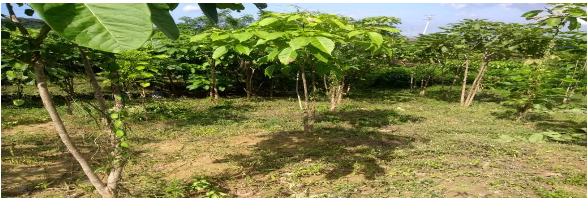
Imagen 3: Siembra cuenca Arroyo Samudio – Después