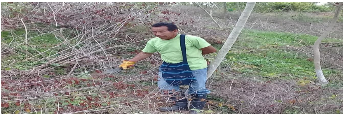
Imagen 2: Limpieza cuenca Arroyo Samudio – Durante.